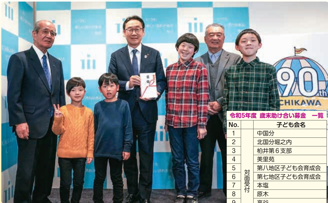
令和5年度 歳末助け合い募金 一覧