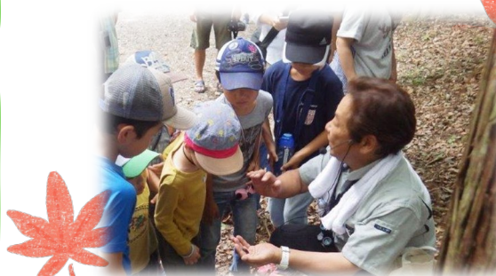
※自然観察会の様子。(イメージ)