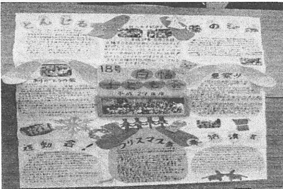
◎ 壁新聞の部：白幡子ども会